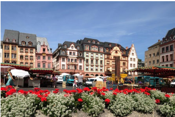
Wochenmarkt auf dem Marktplatz

Nach 2-jähriger Unterbrechung werden wir in diesem Jahr wieder eine Herbstfahrt durchführen. Sie findet am Samstag, den 27. August 2022 statt und führt uns nach Mainz am Rhein.